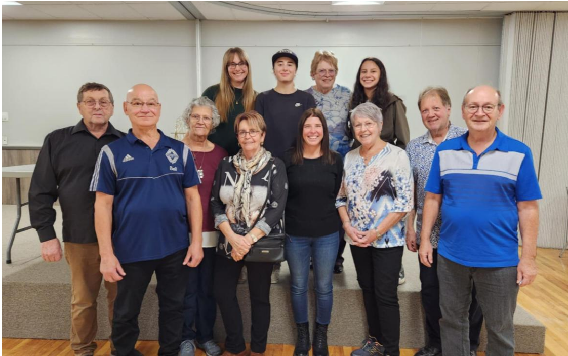
Les hôtes de la soirée, l'équipe de la FADOQ ainsi que celle du CABÉ.